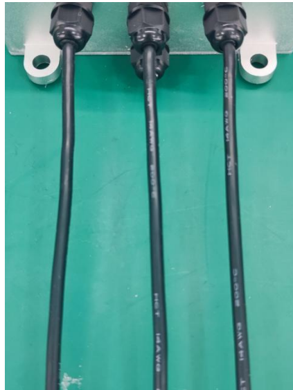
图 2 电调三相输出线

2.1 电调三相输出线：上图 2 中 3 条黑色 14AWG 的硅胶线是连接直流无刷电机的三相输出线。